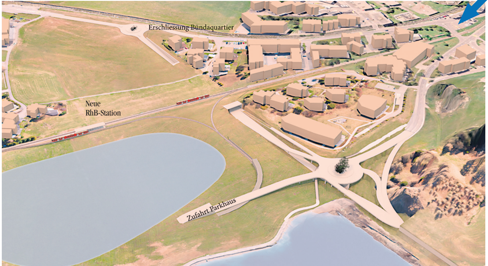
Die Umfahrung von Davos mit Hub beim Davosersee, Zufahrt zum Parkhaus im Davosersee, zur Flüelastrasse, die neue Erschliessung des Bünda Quartier und der aufgehobene Bahnübergang Flüelastr./BMW-Garage (s. Pfeil).